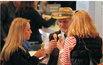
Verkostung zum Firmenevent