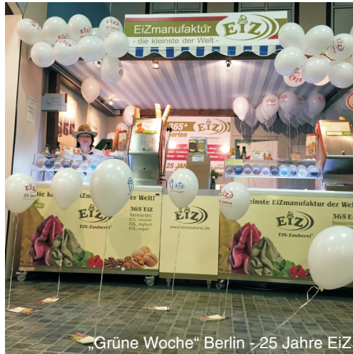
„Grüne Woche“ Berlin - 25 Jahre EiZ